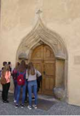
Tür zum Lutherhaus