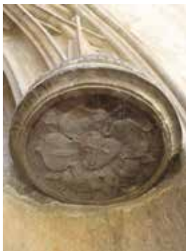
Lutherrose am Lutherhaus